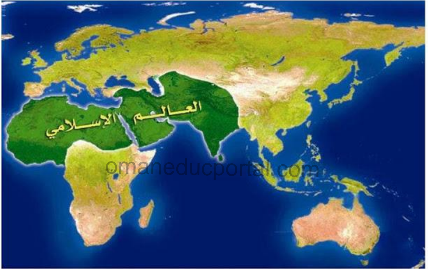
خريطة (١) : العالم الإسلامي في أوائل القرن السابع الهجري